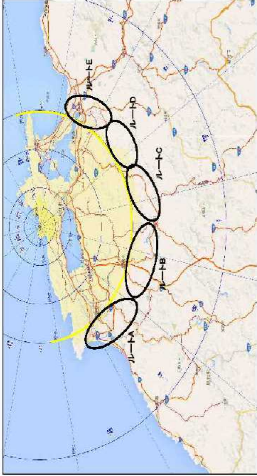
島根サイトのUPZ外モニタリングルート区域 (案)