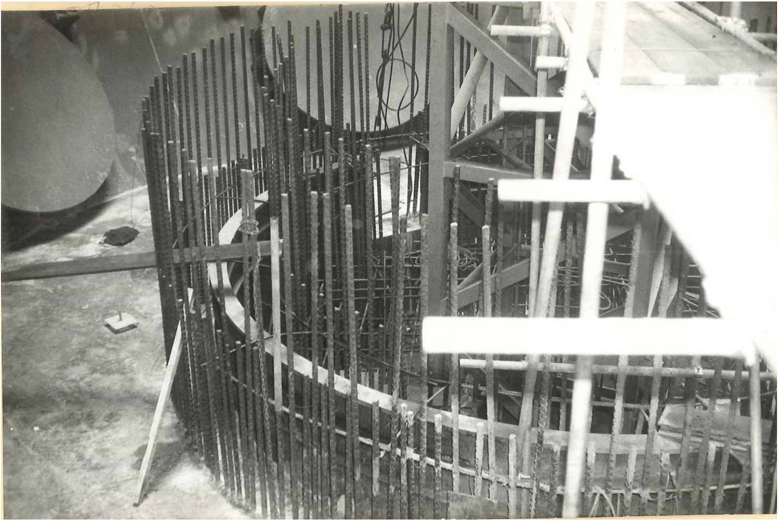
定着筋 建設時写真