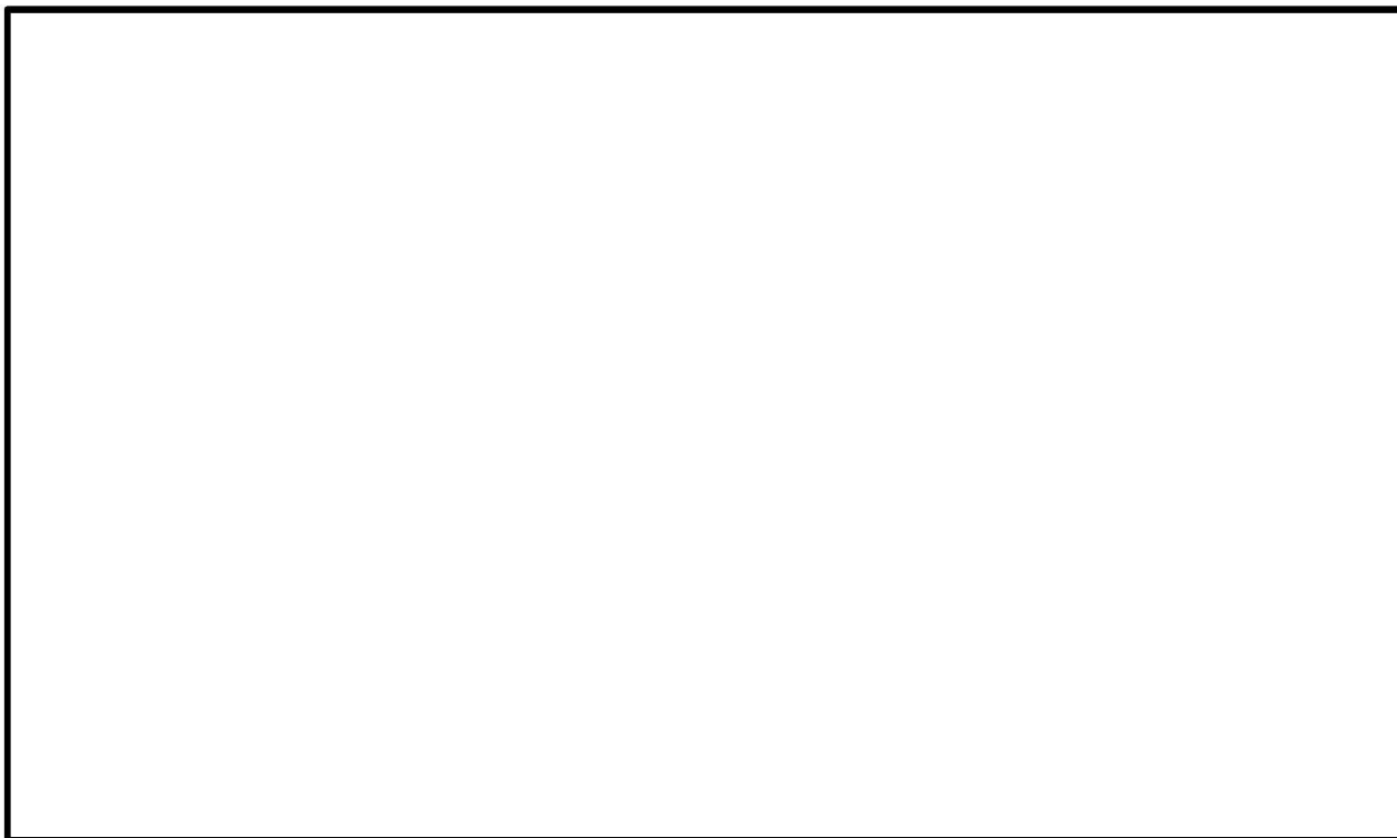
別紙 3-1 図 中性子遮蔽材の質量減損データ (注) (自社開発品[MREX レジン]及び NS-4-FR (1) )

前頁に示した中性子遮蔽材（エポキシ系樹脂）の質量減損率算定式 (1) の基となる質量減損データと MSF-28P 型の中性子遮蔽材（エポキシ系樹脂、自社開発品）の質量減損データを重ねたものを別紙 3-1 図に示す。図に示すとおり、両者の質量減損率は同等であり、文献の質量減損率算定式を用いることは妥当である。