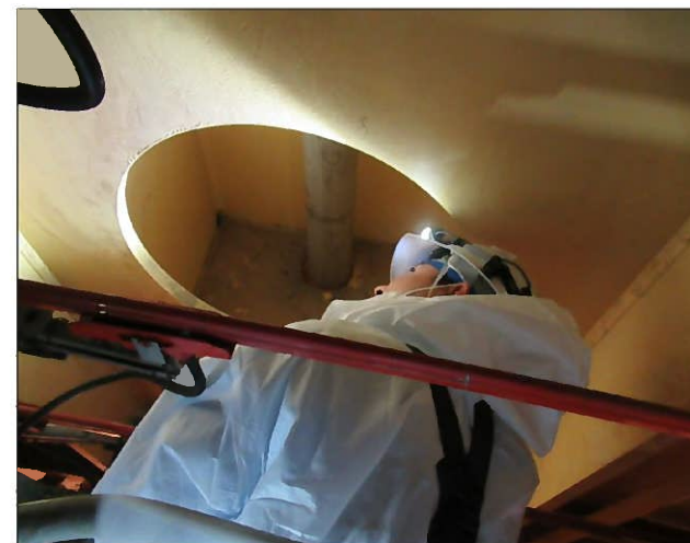
改善後の点検状況（試運用の実施状況）