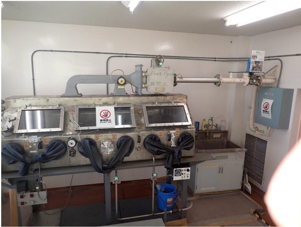
写真1 グローブボックス前面側