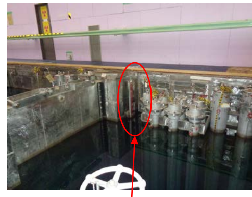
水位尺により目視での水位の監視可能

商用電源が失われることで制御室の機能(監視機能)は喪失するが、監視の必要がある使用済み燃料貯蔵施設の水位については、現場にて目視で確認することで対応可能。以上のことから、EAL事象(AL-JM51 SE-JM51)について適用外とする。