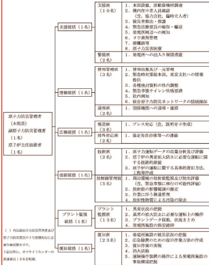
別図1 原子力防災組織