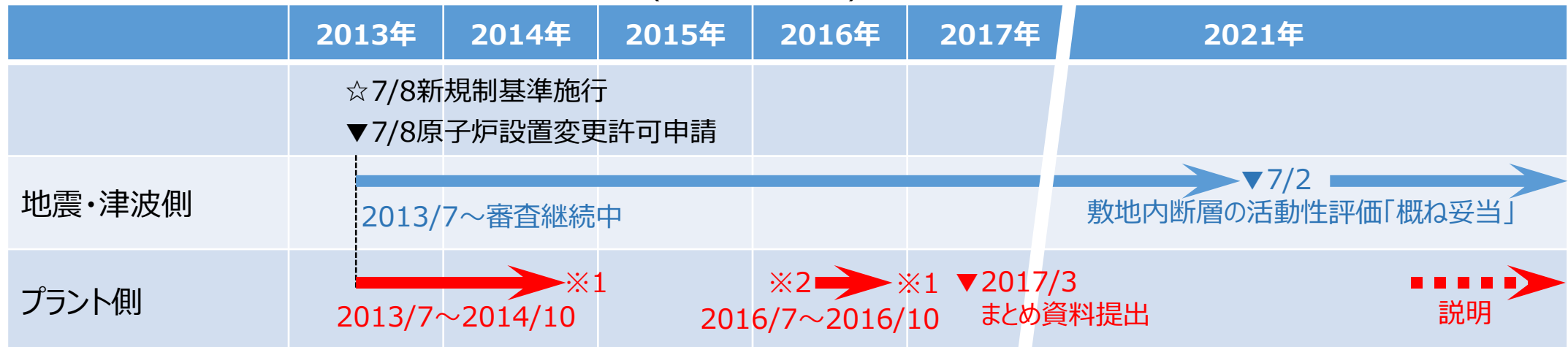
泊発電所3号炉 新規制基準適合性審査の経緯(審査会合の期間)