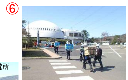
⑥ 関西電力 美浜原子力発電所 PR館