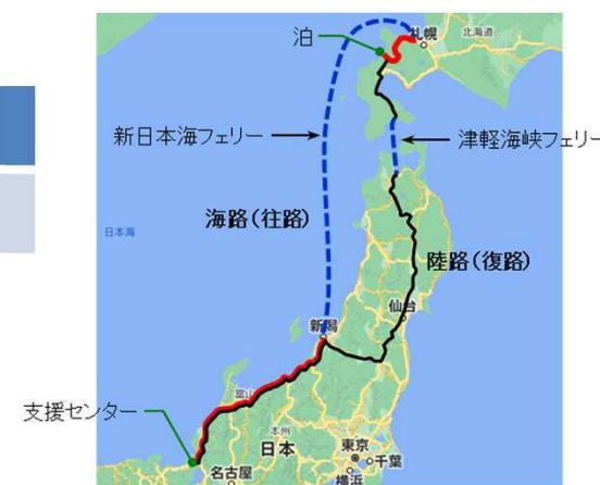
民間フェリー航路を活用した実走行訓練

➤ 実走行訓練のうち、泊原子力発電所には、往路を民間フェリーを活用した搬送ルートとし、復路を陸路確認として実施。