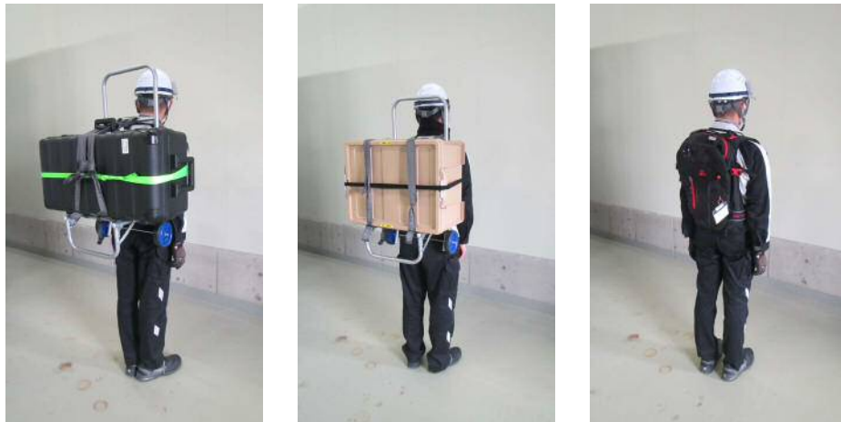
ドローン資機材搬送