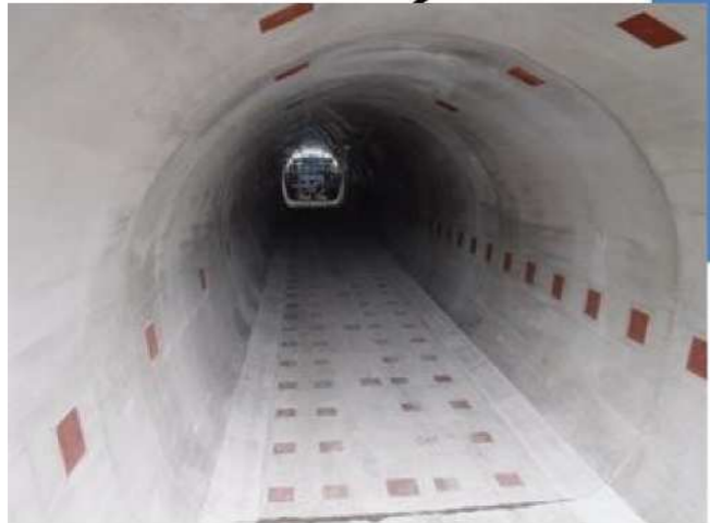
電源ケーブル等が通る予定の通路