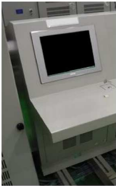
緊急時制御室に設置予定の制御盤 (製作中)

➤ 意図的な航空機衝突などへの可搬式設備を中心とした対策(可搬式設備・接続口の分散配置)。バックアップ対策として常設化を要求(特定重大事故等対処施設の整備)