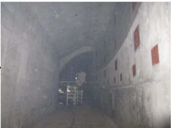
制御ケーブル等が通る予定の通路