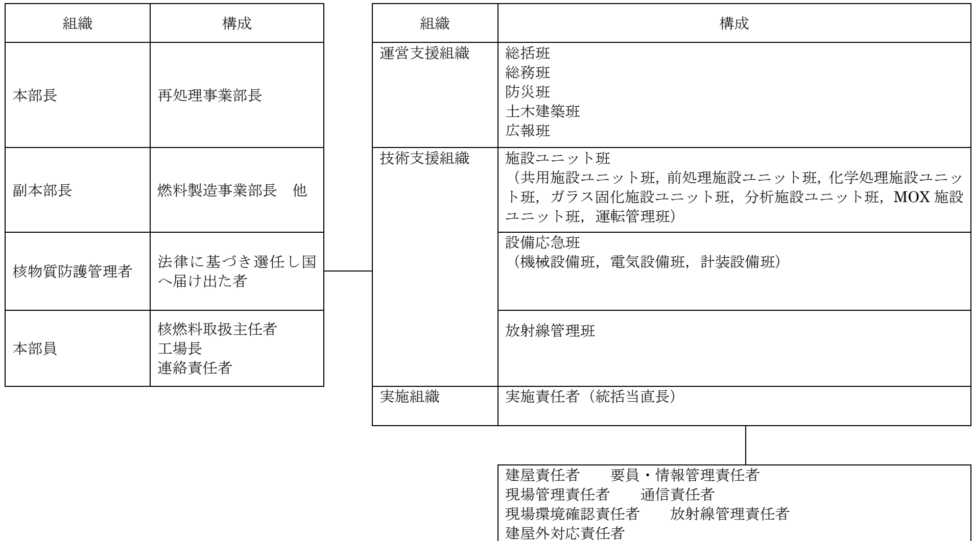
第1図：核物質防護に関する緊急時の組織体制図