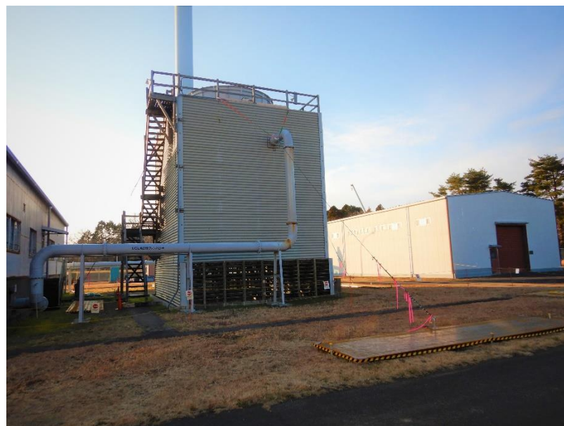
UCL系統冷却塔のワイヤーロープによる固定写真

一方、UCL系統は廃止措置の進捗状況に応じて必要な冷却能力が大幅に減少することも考慮して、UCL系統冷却塔を小型の設備に置き換えることを検討している。