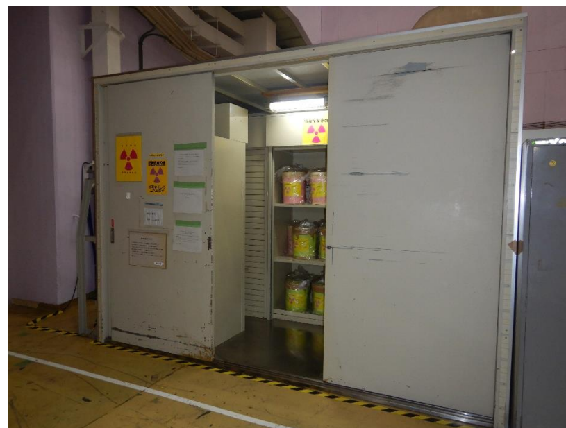
金属製の保管庫(保管廃棄施設)の一例