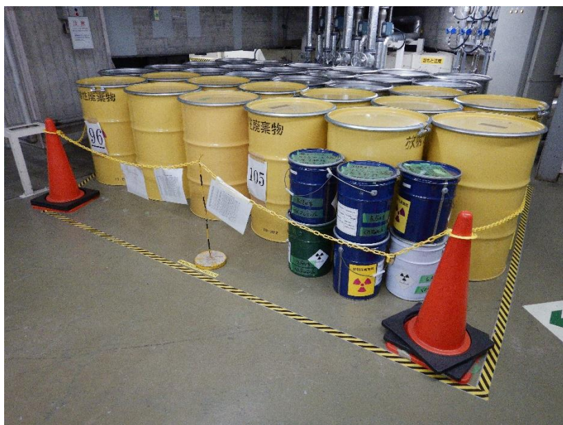
金属製の容器を保管している保管廃棄施設の一例