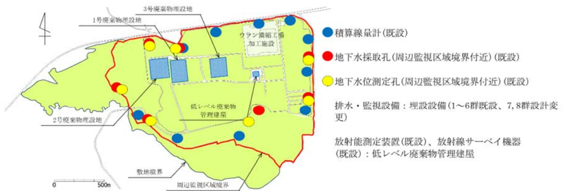
第2図 1号廃棄物埋設施設の監視測定設備の設置箇所概略図 (埋設する放射性廃棄物の受入れの開始から覆土完了まで)

なお、積算線量計、地下水採取孔(周辺監視区域境界付近)、地下水位測定孔(周辺監視区域境界付近)、放射能測定装置(低レベル廃棄物管理建屋)、放射線サーベイ機器(低レベル廃棄物管理建屋)は1号、2号及び3号廃棄物埋設施設の共用で既設の設備を利用する。