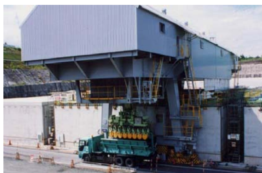
第1図 廃棄物埋設地における埋設クレーンによる吊上げ