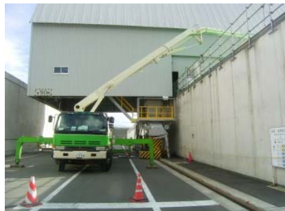
第4図 埋設設備内への充填材充填