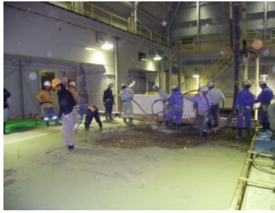
第5図 埋設設備区画上部への覆い設置